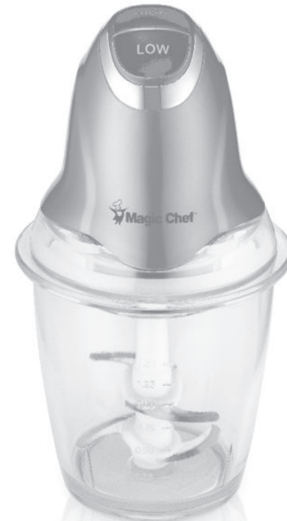
MEC-H15S 매직셰프 다용도 다지기